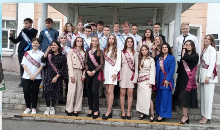
9Б класс. Последний звонок 18.05.2022