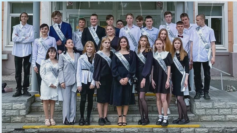
9А класс. Последний звонок 18.05.2022