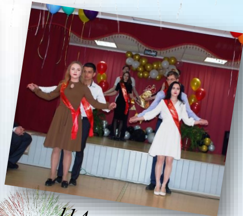
11А класс. Вальс