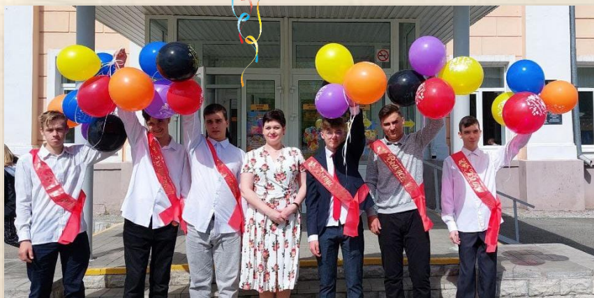
9В класс. Последний звонок 18.05.2022